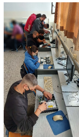
Εικόνα 5: Μαθητές συντηρούν – αναβαθμίζουν τους υπολογιστές του εργαστηρίου.