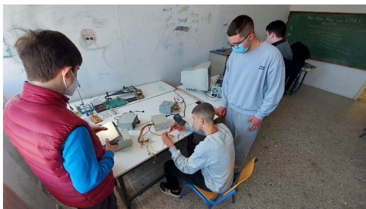
Εικόνα 1: Μαθητές ελέγχουν τη λειτουργία τροφοδοτικών που έχουν συγκεντρώσει.

Σε αυτό το στάδιο οι μαθητές μαζί με τους συνεργαζόμενους της υποδράσης καθηγητές έκαναν αναζήτηση υπάρχοντος εξοπλισμού ΤΠΕ στο σχολείο και έγινε έλεγχός του για προβλήματα – βλάβες. Στην συνέχεια προχώρησαν στο διαχωρισμό του, σε εξοπλισμό που μπορεί να επισκευαστεί – συντηρηθεί – αναβαθμιστεί και να επαναλειτουργήσει και σε εξοπλισμό που δε μπορεί να γίνει σε αυτό κάποια από τις προηγούμενες ενέργειες.