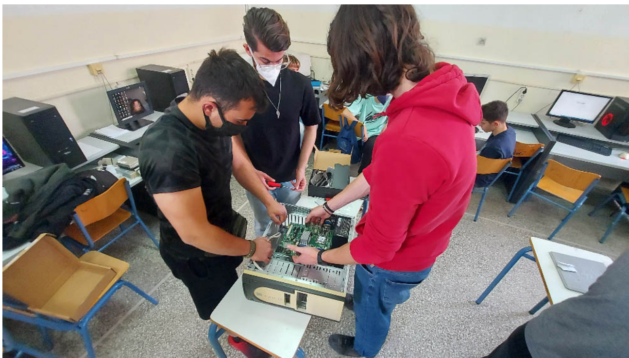
Εικόνα 7: Μαθητές αντικαθιστούν τη κατεστραμμένη μητρική πλακέτα και το καμένο τροφοδοτικό ενός επιτραπέζιου υπολογιστή με νέα.