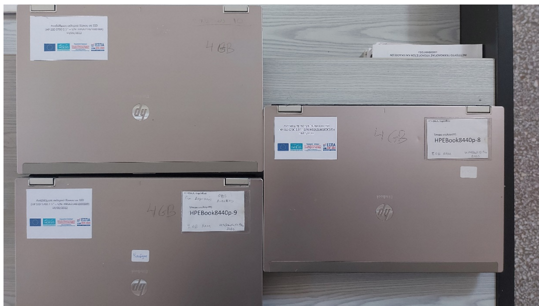
Εικόνα 11: Φορητοί υπολογιστές του σχολείου που επισκεύασαν-αναβάθμισαν οι μαθητές.

Έγινε τοποθέτηση και λειτουργία μερικού εξοπλισμού ΤΠΕ που επισκευάστηκε – αναβαθμίστηκε στα πλαίσια αυτής της υποδράσης στο σχολείο. Επίσης έγινε ενημέρωση της Δ/σης Β΄/θμιας Εκπ/σης Κορίνθου για τη διάθεση εξοπλισμού, το οποίο θα μπορούσε να δοθεί σε άλλες σχολικές μονάδες της Α/θμιας ή Β΄/θμιας Εκπαίδευσης Κορινθίας, που έχουν ανάγκη.