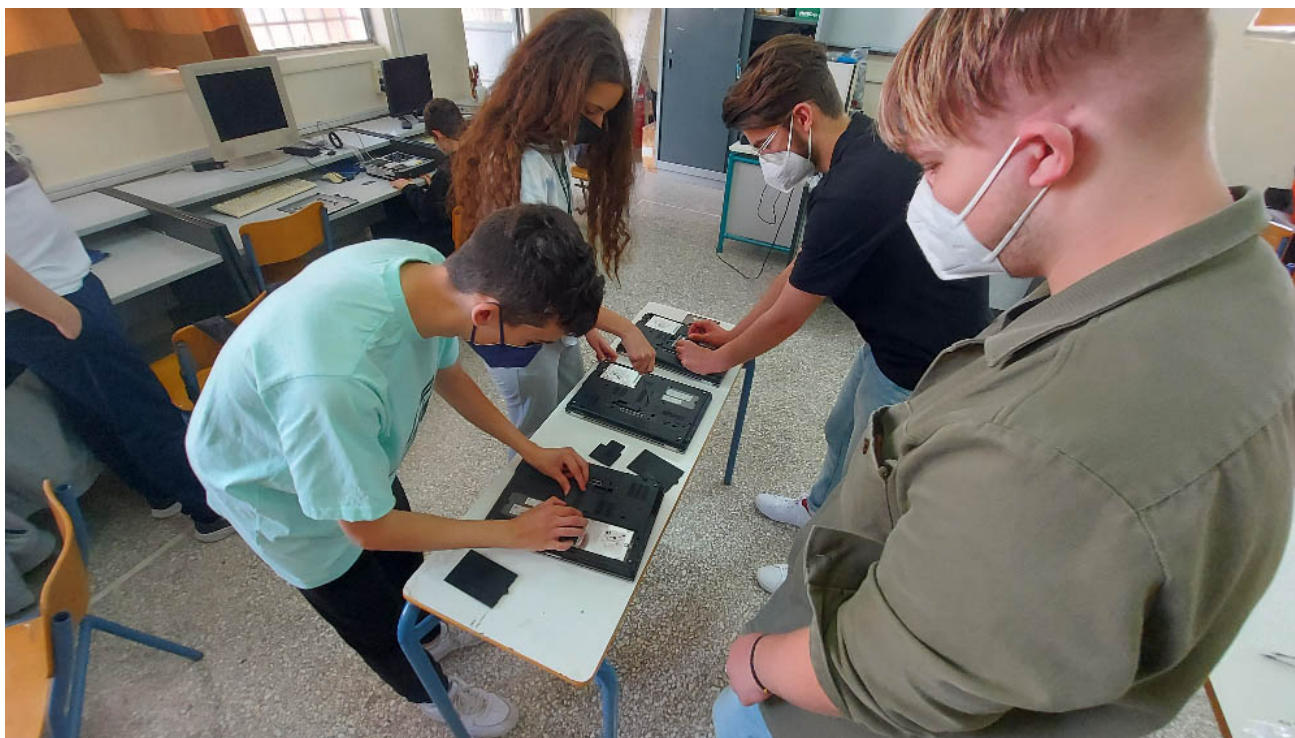
Εικόνα 8: Μαθητές αναβαθμίζουν τη κεντρική μνήμη RAM φορητών υπολογιστών.