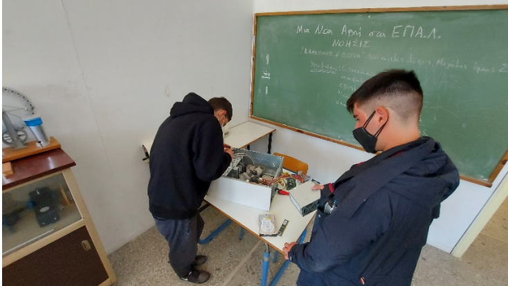
Εικόνες 2 - 4: Μαθητές ελέγχουν τη λειτουργία επιτραπέζιων και φορητών υπολογιστών που έχουν συγκεντρώσει.