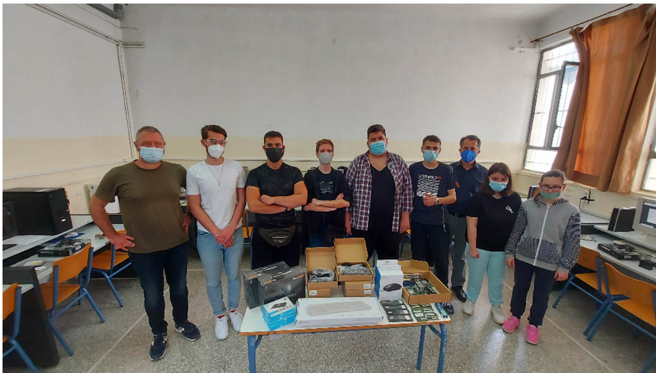
Εικόνα 6: Μαθητές με τους καθηγητές τους παραλαμβάνουν τα υλικά – τον εξοπλισμό ΤΠΕ από τις δαπάνες της υποδράσεις..

Οι μαθητές μαζί με τους εκπαιδευτικούς της υποδράσεις συνεχίζουν να παραλαμβάνουν υλικά και εξοπλισμό ΤΠΕ και να αναβαθμίζουν – συντηρούν και επισκευάζουν υπολογιστές του σχολείου τους.